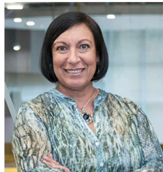
Garré: A troca de informações ganha centralidade em contextos de crise

como o da pandemia de Covid-19, que força muitas marcas a refletir sobre que tipo de comunicação devem ter e como devem agir. O cuidado deve ser tomado no sentido de evitar mensagens que possam ser mal interpretadas ou conteúdos que possam gerar desserviços.