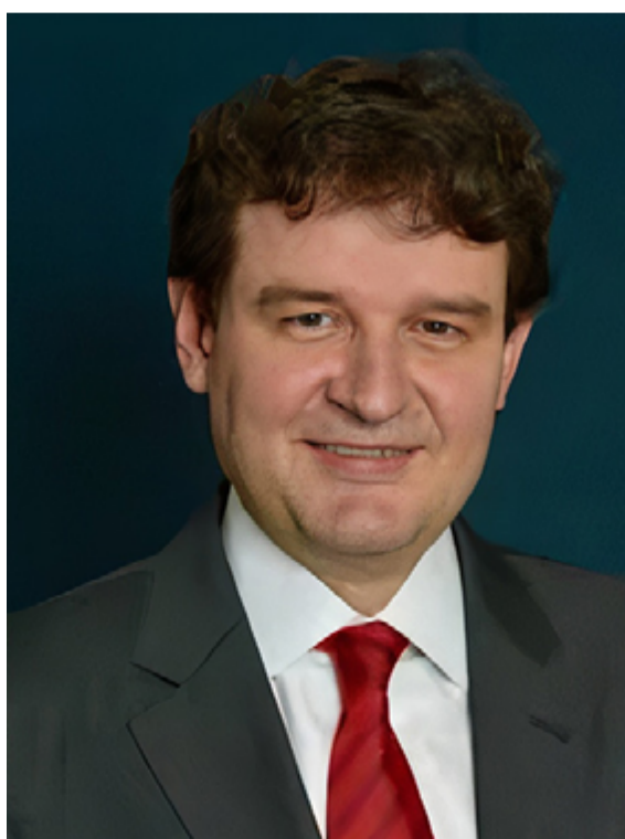
Ambiel: “As organizações podem colocar os empregados em banco de horas, tendo 18 meses para compensar esse período”